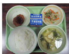
12/1 わかめの味噌汁・れんこん肉詰めフライ・はんぺんのごま酢和え