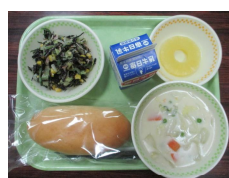
12/4 ミルクパン・白菜のクリーム煮・ひじきのサラダ・パイナップル