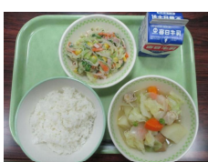
11/30 かぶのポトフ・春雨サラダ

今年の給食もあと10回ほどとなりました。給食だよりの裏面にある「温活のススメ」を読んで、健康のための食事について考えましょう。