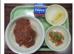
12/6 ソフト麺ミートソース・大根のサラダ・りんご