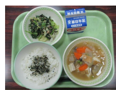
12/5 厚揚げの味噌煮・のり酢あえ・ふりかけ